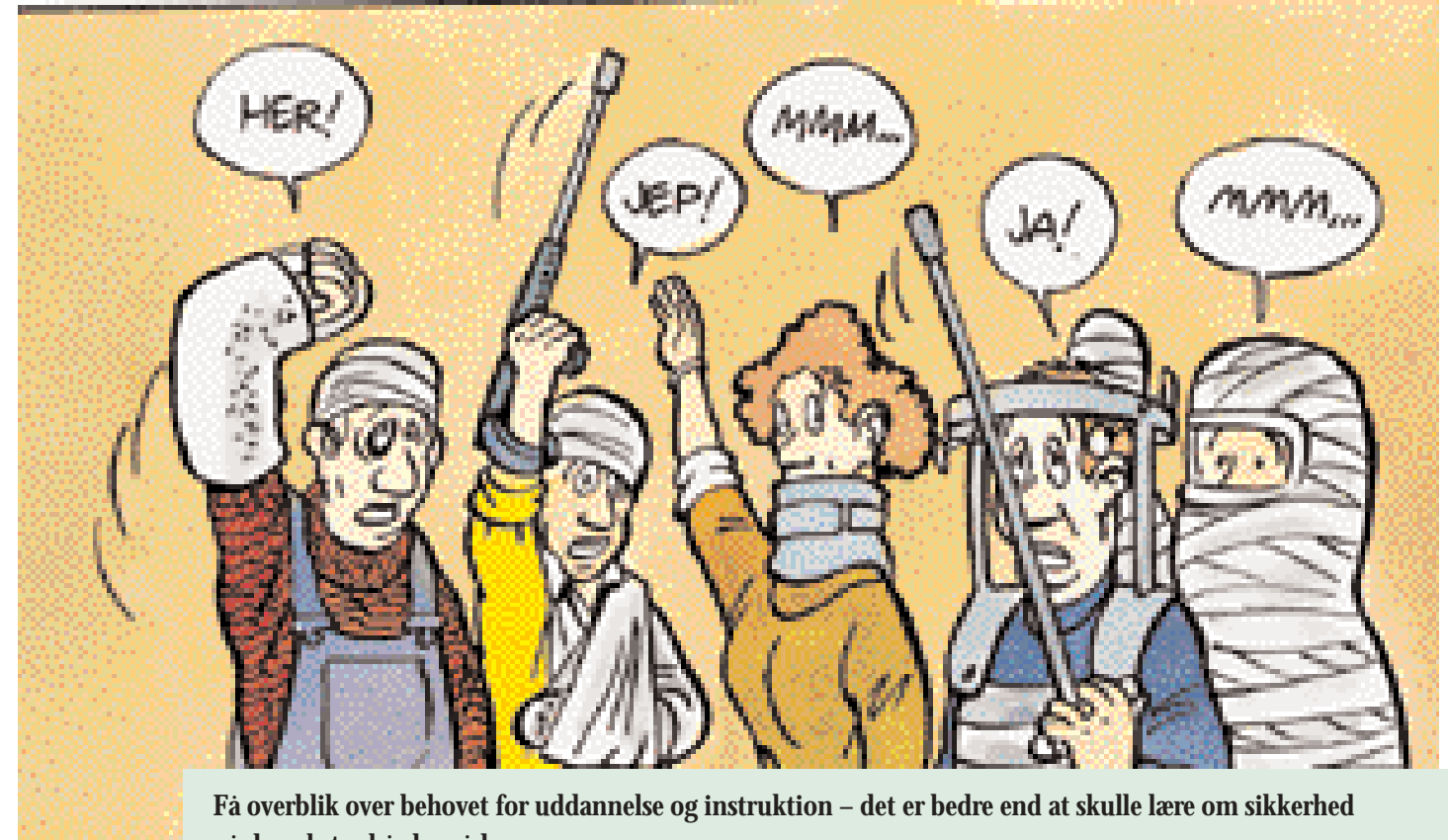
Få overblik over behovet for uddannelse og instruktion – det er bedre end at skulle lære om sikkerhed på den ekstra hårde måde.