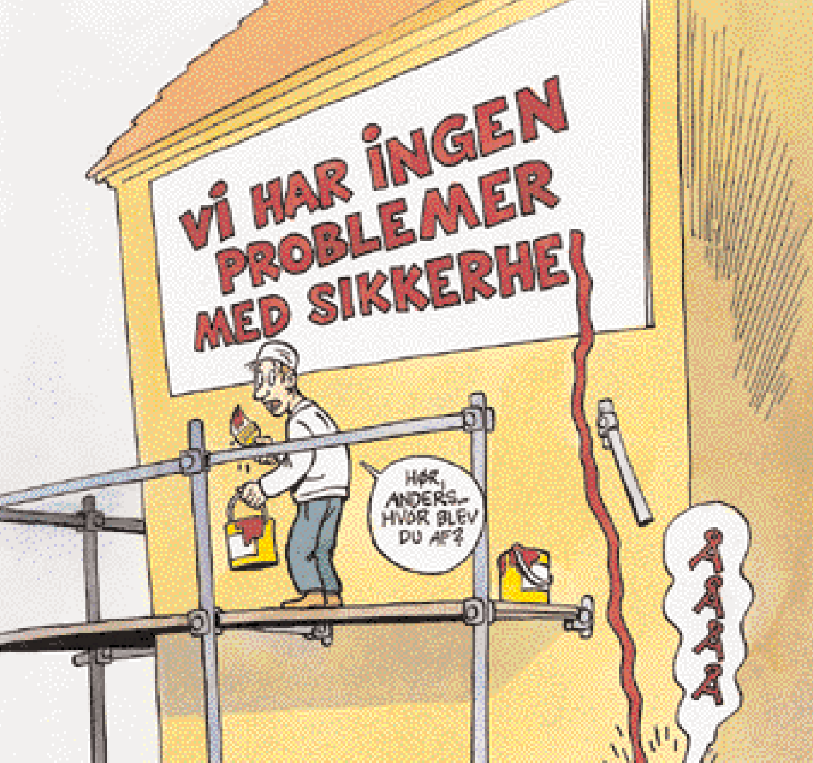
Gode råd om sikkerhed