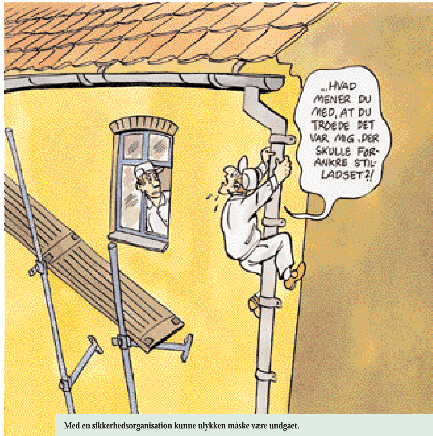
Med en sikkerhedsorganisation kunne ulykken måske være undgået.

At have et godt arbejdsmiljø betyder også meget for jeres image i omverdenen. Som I måske allerede har opdaget, lægger stadig flere kunder i dag vægt på, at arbejdsmiljøet er i orden, inden de skriver under på kontrakten. Og så er der jo Arbejdstilsynet - ville det ikke være dejligt at få et smil i stedet for en bøde? Samtidig får I måske en bedre placering i Arbejdstilsynets system. De har 3 niveauer, hvor 1 er det bedste. At få en god placering er noget, der er værd at prale af, og det gavner virksomhedens ansigt ud ad til.